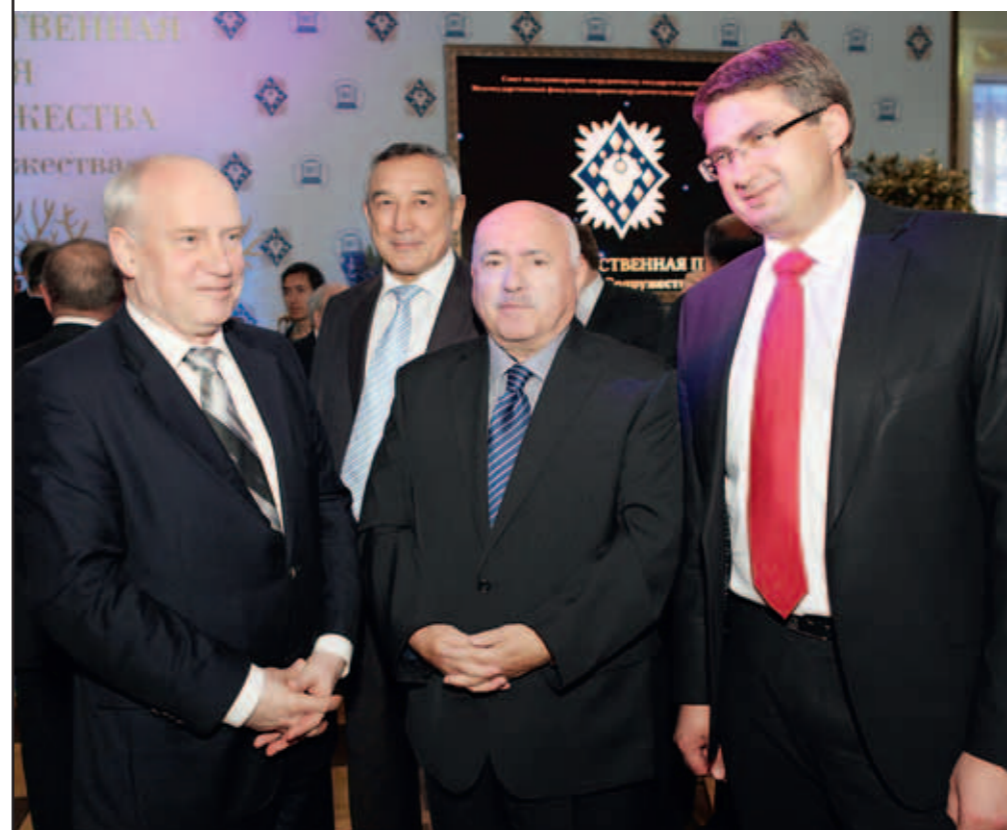
Председатель Исполнительного комитета – Исполнительный секретарь СНГ Сергей Лебедев, заместитель председателя Исполнительного комитета СНГ – Исполнительного секретаря СНГ Токтасын Бузубаев, Николай Чергинец и первый заместитель министра культуры Республики Беларусь Владимир Карачевский.

Я убежден, что современному автору необходимо понимать сущность всего, что происходит в мире. Он должен хорошо разбираться в экономике, а также обладать умением делать грамотные выводы. Изначально писатель наделен божественной возможностью – затронуть сердце читателя, открыть ему что-то